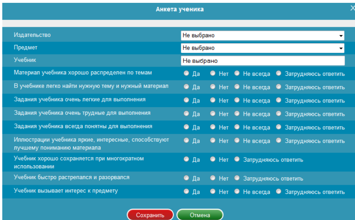
Рисунок 1 – Анкета ученика

2. Рядом с каждым вопросом анкеты необходимо указывать ответы посредством выбора подходящего варианта щелчком по нему левой кнопкой мыши.