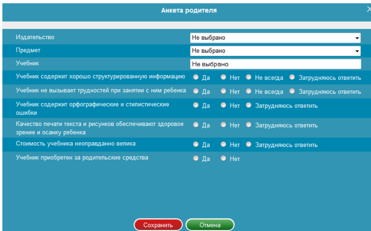
Рисунок 1 – Анкета родителя

2. Рядом с каждым вопросом анкеты необходимо указывать ответы посредством выбора подходящего варианта щелчком по нему левой кнопкой мыши.